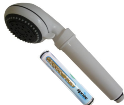
Douchette blanche 6030