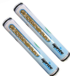
Cartouche chlogon 6035