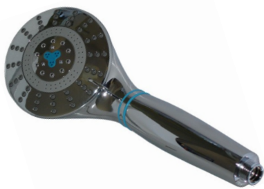
Douchette luxe 6033

Dévissez le manche de la douchette (pour les modèles 6030 et 6032), tourner d'un quart de tour vers la gauche puis tirer vers le bas pour le modèle 6033 (Premium), retirez la cartouche usagée, mettez en place la nouvelle cartouche, Selon la qualité de votre eau et le nombre de personnes qui l'utilisent, la cartouche du filtre douche doit être remplacée après 6 mois d'utilisation ou dès que vous commencez à sentir de nouveau une légère odeur de chlore ou sensation de peau sèche ou irritée.