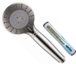
Douchette luxe 6033

C'EST LA SOLUTION POUR SUPPRIMER TOUTES IRRITATIONS ET DÉMANGEAISONS DUES À UN TAUX EXCESSIF DE CHLORE ET DE CALCAIRE DANS L'EAU DU RÉSEAU