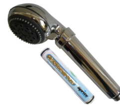
Douchette chromée 6032